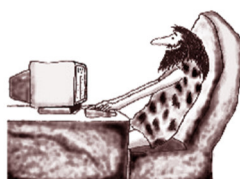
schön, dass es Dich gibt!