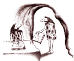
Wieder so'n LV

Ich bin Unternehmer im Sinne § 14 BGB und habe die AGB und Datenschutzerklärung gelesen und akzeptiere diese ( www.gaeb-tools.de/agb/ ). Zahlungsbedingungen: Die Gebühr wird vorab per Rechnung fakturiert und muss unabhängig vom Zahlungsziel vor dem Kurs auf dem Konto der T&T Datentechnik GmbH gutschrieben sein. Bei Rechnungslegung ins Ausland 10,00 Euro Aufschlag. Mehrwertsteuer entfällt bei Angabe der USt-ID-Nr. innerhalb der EU. Die nachfolgenden Seminar-Bedingungen habe ich gelesen und akzeptiert.